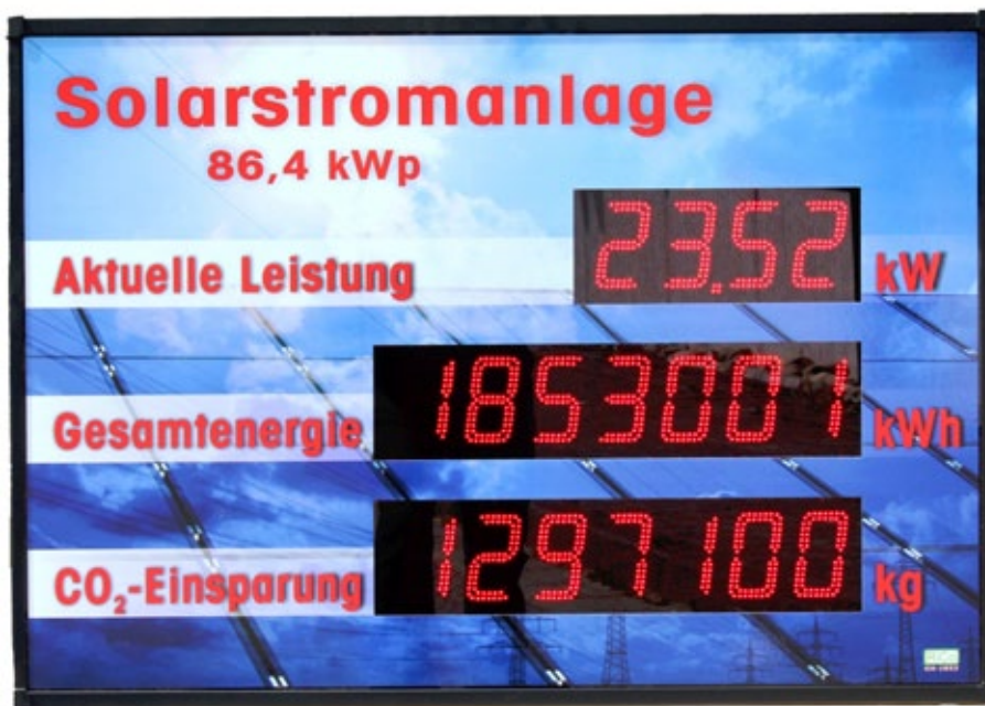
GA-1853r mit Standardlayout L15