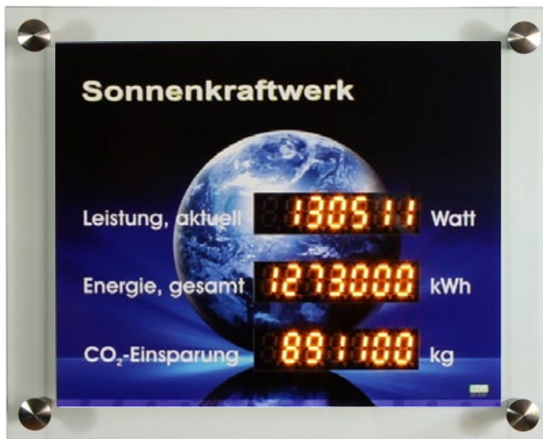
GA-600o Standardlayout „Earth L16“