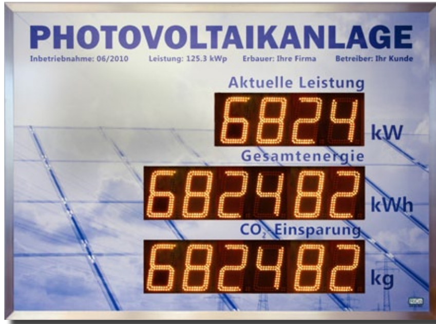
GA-11353o mit Standardlayout