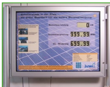
Alu silber eloxiert mit runder Aufständering Aluminium silver anodized with round stands