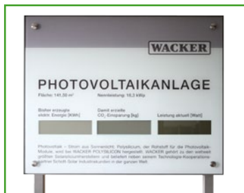
Alu silber eloxiert, rahmenlose Optik mit eckiger Aufständering Aluminium silver anodized, frameless with square-cut stands