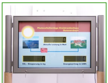
Alu pulverbeschichtet mit RAL-Farbtönen grau, runde Aufständering Aluminium powder coated with RAL-colour grey and round stands