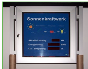
Alu silber eloxiert mit eckiger Aufständering Aluminium silver anodized with square-cut stands