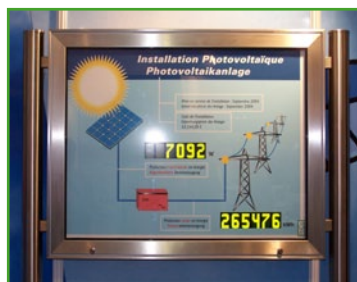
Edelstahloberfläche, gebürstete Optik mit runder Aufständering Satin stainless steel surface with round stands